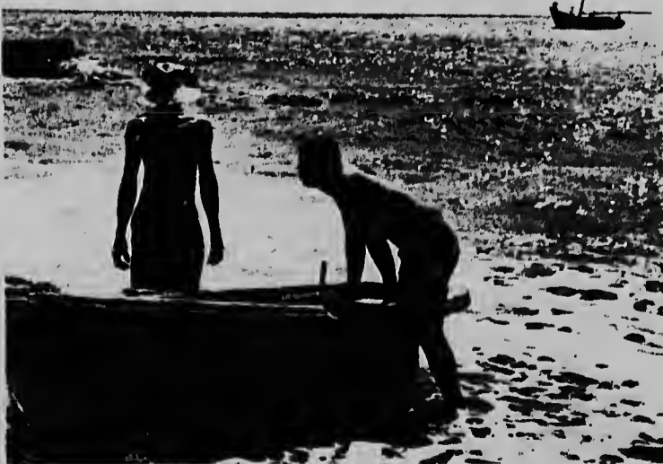
Dos piscador di Saba a yega costa di nan isla den un boto chikitu di rema, despues qu nan a angra nan boto grandi pafor den laman. Tur cos qu mester di dje riba e isla ta ser importa pa via maritima.

E gran atraccion di e isla, ta su belleza natural y ambiente tranquillo caminda bo por sosega maravillosamente.